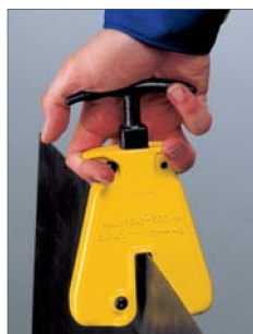
Mise en place